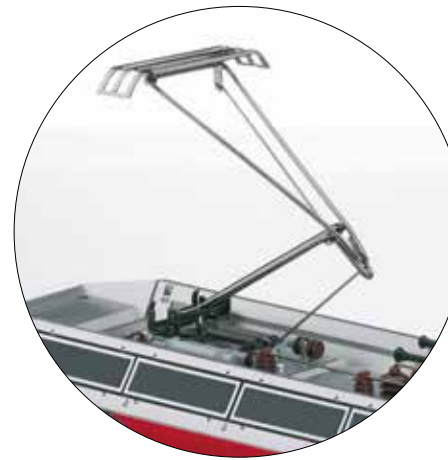
Motorisch heb- und senkbare Stromabnehmer

7:30 Uhr in Zermatt und erreichte über Visp, Brig, Andermatt, Disentis/Mustér und Chur schließlich den Engadiner Ort St. Moritz nach knapp elf Stunden. Mit diesem Zug wollten die drei Schweizer Bahngesellschaften RhB, Furka-Oberalp-Bahn (FO) und Visp-Zermatt-Bahn (VZ) an die Tradition der vor dem Ersten Weltkrieg beliebten Luxuszüge anknüpfen. Dies gelang und so durchquert der Glacier-Express noch heute auf 291 Kilometern Meterspur regelmäßig die Kantone Graubünden, Uri und Wallis.